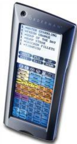
6: Orderman MAX 2

ORDERMAN MAX 2: Der ☒Sunnyboy☒ der Orderman Crew - kontrastreich, hell und blendfrei auch im gleißenden Sonnenlicht - erobert die Szene. Das sonnenlichttaugliche Display funktioniert immer, drinnen und draußen! Dazu die bedienerfreundliche Eingabe mit Stift und Touch ☒ für maximalen Komfort und Geschwindigkeit. Seine ausgereifte Technik und maximale Funktionalität verrät den Spezialisten und macht ihn so attraktiv für die verschiedensten Typen von Lokalen!