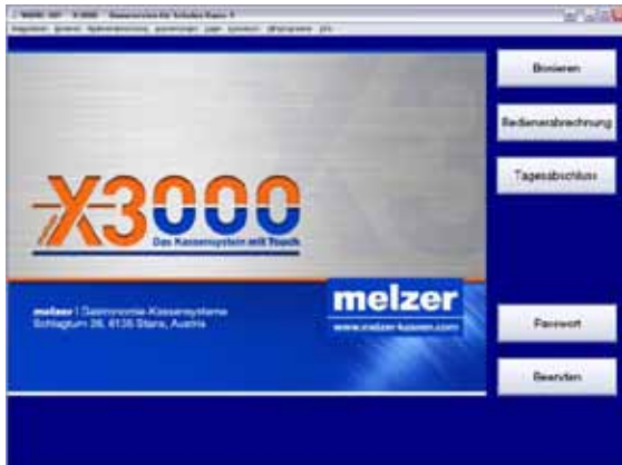
1: X3000 Hauptmaske

X3000 ist das Restaurant Abrechnungs- und Kontrollsystem für den modernen Unternehmer.