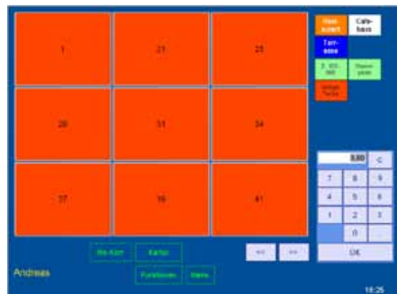
2: Belegte Tische

Das System lässt eine freie Tischanlage (bis 14-stellige Tischnummer und mehrere Rechnungen pro Tisch) zu. Am Tischplan wird ersichtlich, an welchem Tisch schon länger nichts mehr aufgenommen wurde (violette Tische), um das Service darauf aufmerksam zu machen. Mit einer einfachen Funktion können Positionen von einem Tisch auf einen anderen transferiert werden.